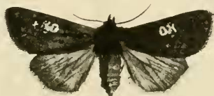
Cymatophora octogesima ab. Frankii ♀.